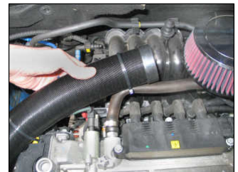
Fig. # 20