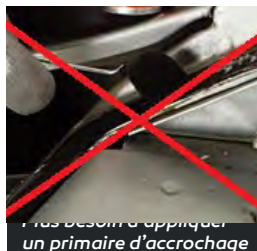
Plus besoin d'appliquer un primaire d'accrochage