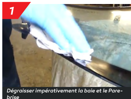
1 Dégraisser impérativement la baie et le Pare-brise

Dégraissier impérativement. Prendre une cartouche, enlever complètement l'opercule au fond de la cartouche, percer l'orifice avec un objet pointu. Prendre une buse et la couper en V de façon à pouvoir faire un joint triangulaire d'une épaisseur de 10 à 14 mm minimum. Pour avoir un joint régulier, utiliser un pistolet pneumatique et posez la colle sur la tôle ou sur l'ancien joint. Après la pose le Pare-brise est maintenue sans sangles ni cales. Véhicule libérable sans ou avec double Airbags après 1 heure à une température de +/- 23°.