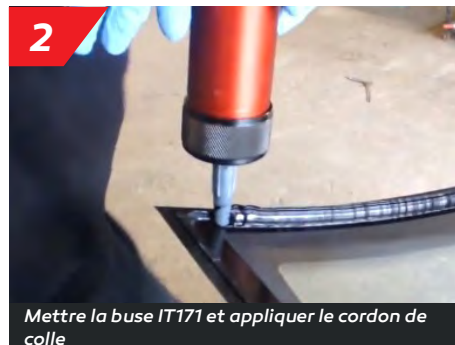
2 Mettre la buse IT171 et appliquer le cordon de colle